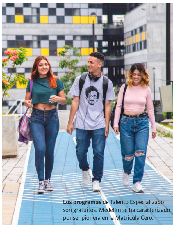
Los programas de Talento Especializado son gratuitos. Medellín se ha caracterizado por ser pionera en la Matrícula Cero.

Finalmente, para el director de Sapiencia, los tres grandes retos de cara a la pospandemia pasan por garantizar el enganche laboral de estos estudiantes, ampliar los acuerdos con universidades y empresas del sector, y fortalecer alianzas con países que están buscando talento en estas industrias. ■